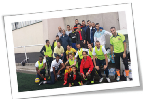
Equipe de foot de l'ATMF

Ce tournoi de foot, réunira d'anciens joueurs qui auront l'occasion de revenir sur ces moments riches dans une ambiance conviviale autour d'un barbecue géant !